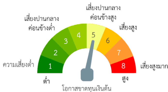
ปัจจัยความเสี่ยงที่สำคัญ