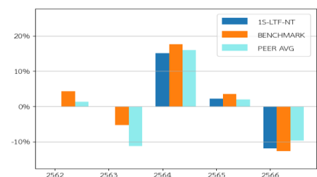
ผลการดำเนินงานย้อนหลังแบบปีกลุ่ม (% ต่อปี)